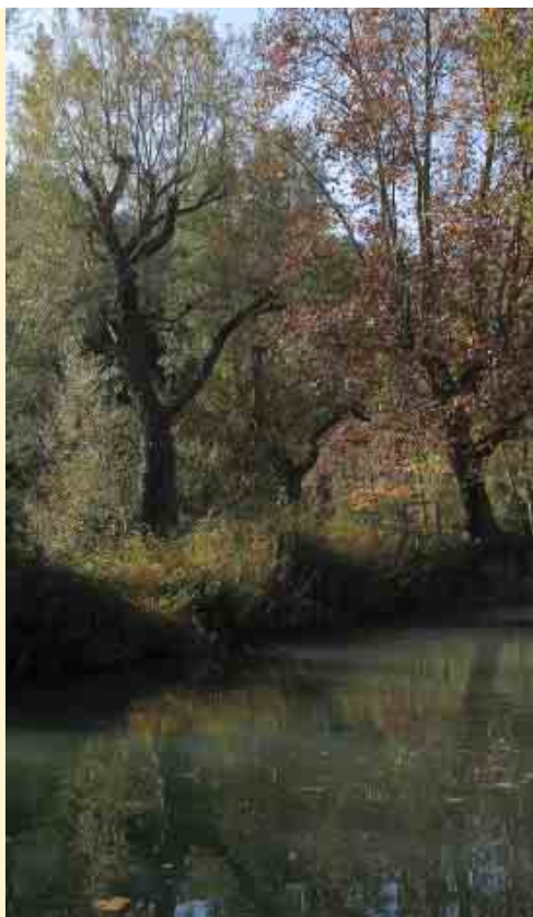
La bassa del Bisbal.

tigi arqueològic ni se sap exactament on era. Se suposa que estava construït prop del monestir de Santa Cecília, entre els torrents de les Coves i de la Font del Llum.