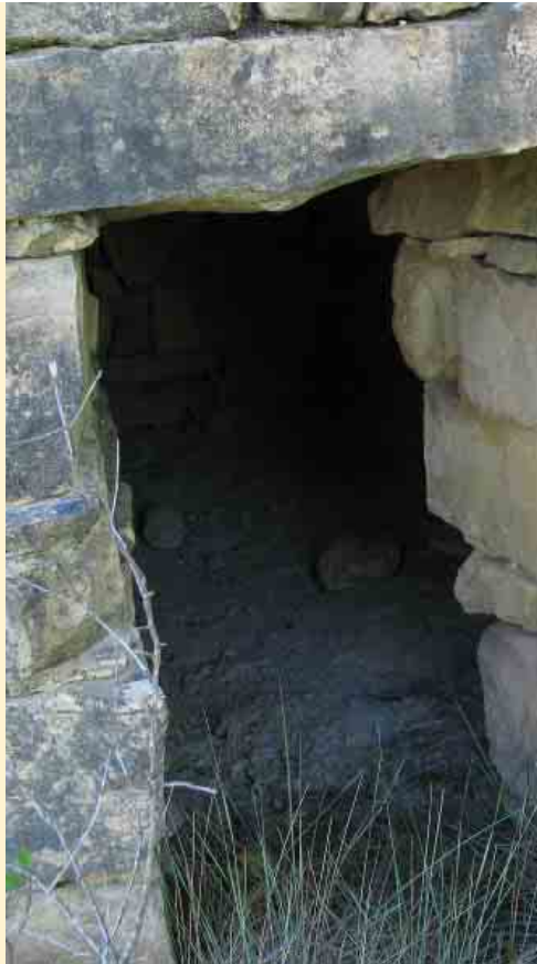
Un detall de la porta d'entrada, que té uns vuitanta centímetres d'altura

la qual es procurava que arrelés vegetació, fet que evitava que la terra s'erosionés i la barraca tingués goteres. A vegades s'hi plantaven lliris blaus.